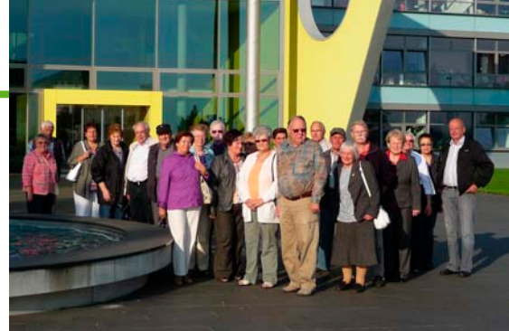
Die Gruppe von Förderern und Freunden der Beschützenden Werkstätte bei Würth Solar in Schwäbisch Hall