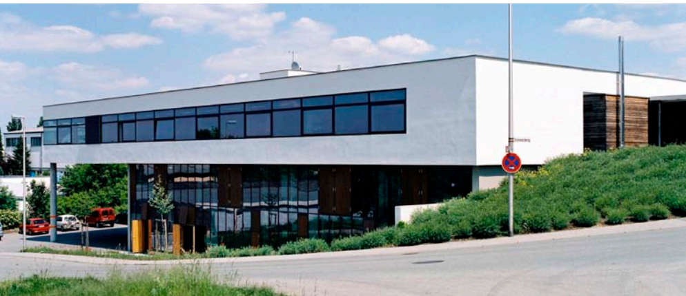
Nächstes Ziel am 26. April 2012 ist unter anderem die Werkstätte in Talheim

Ab sofort werden Anmeldungen für die Fahrt (Zeit: 9 – 17 Uhr) entgegengenommen.