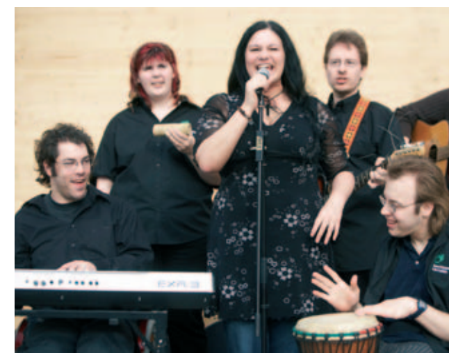
Auch Musiker von „ Better Than “ aus der Beschützenden Werkstätte treten bei „ KulturPur “ am 24. Juli 2009 in Bad Friedrichshall auf.