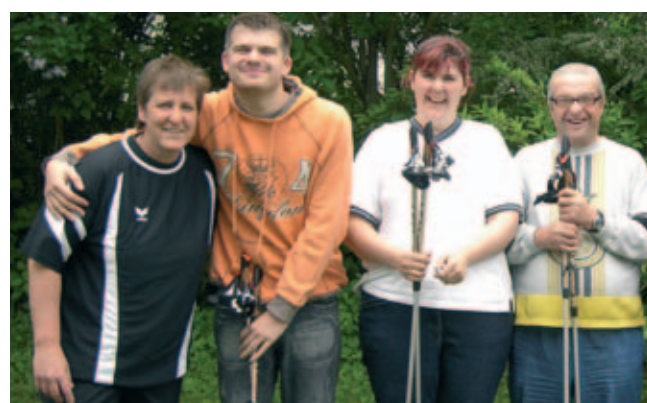
Walkinggruppe Bad-Friedrichshall mit neuen Stöcken.